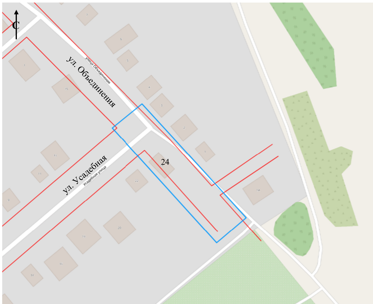
Схема границ подготовки проекта планировки территории (арх. № 142/24)